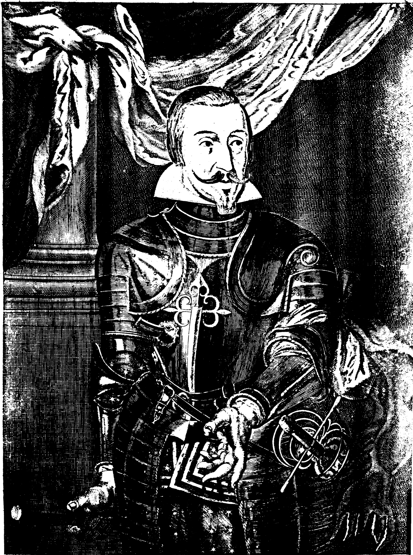
Illustriss. et Excellentissimus Dñs. D. Emanuel de Fonseca, et Zunica Comes de Mont et Fuentes, Consiliarius status Catholicae Maiestatis, Praesidens in supremo Ital Concilio, et Regni Neap. Vicerex, Locumtenens, et Capitanius Generalis.