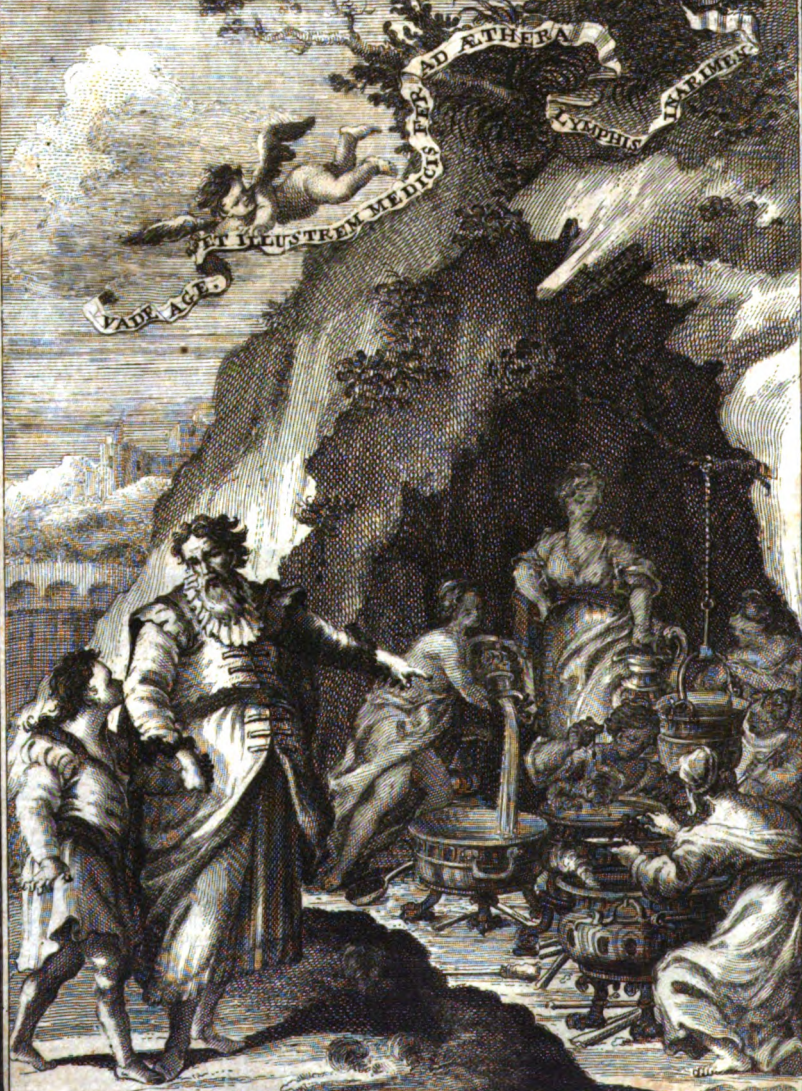
Ant. Baldi In. et del.