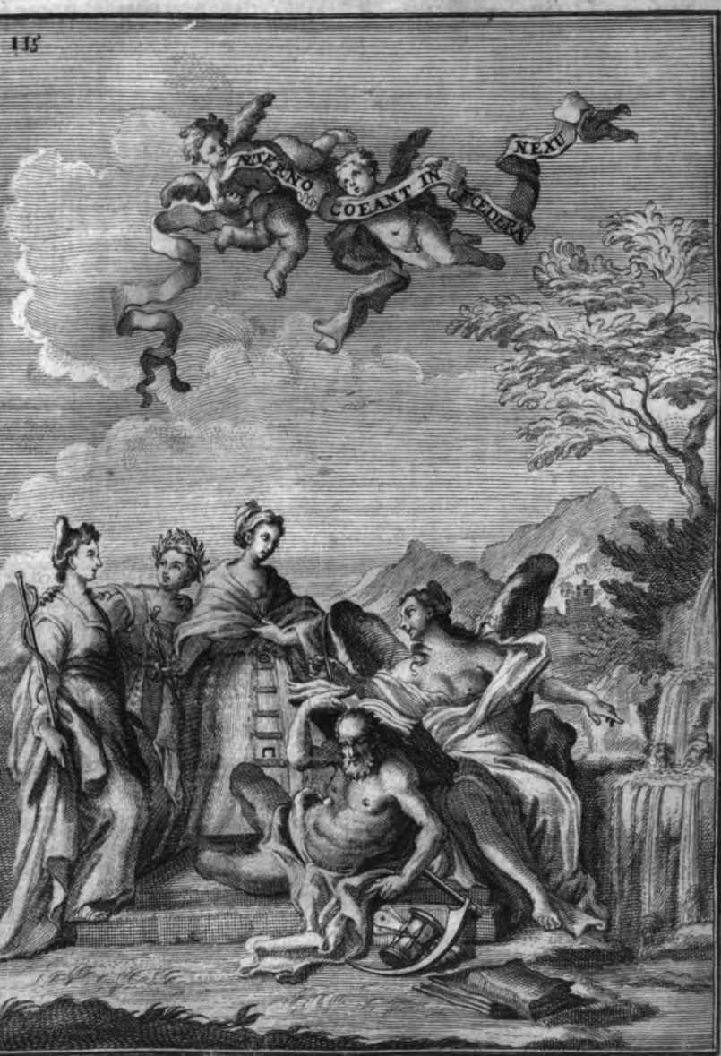
Ant. Baldi In del.