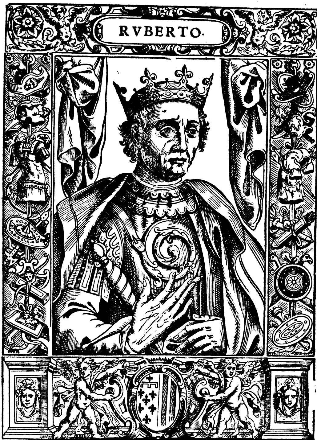
RUBERTO fu terzogenito di Carlo I. di cui, e di Donna Sancia d'Aragona sua moglie, nacque Carlo, detto Senzattera, Duca di Calauria, che morì viuento il padre. Visse Ruberto anni.... & hauendone regnato presso a 34. morì nel 1343.