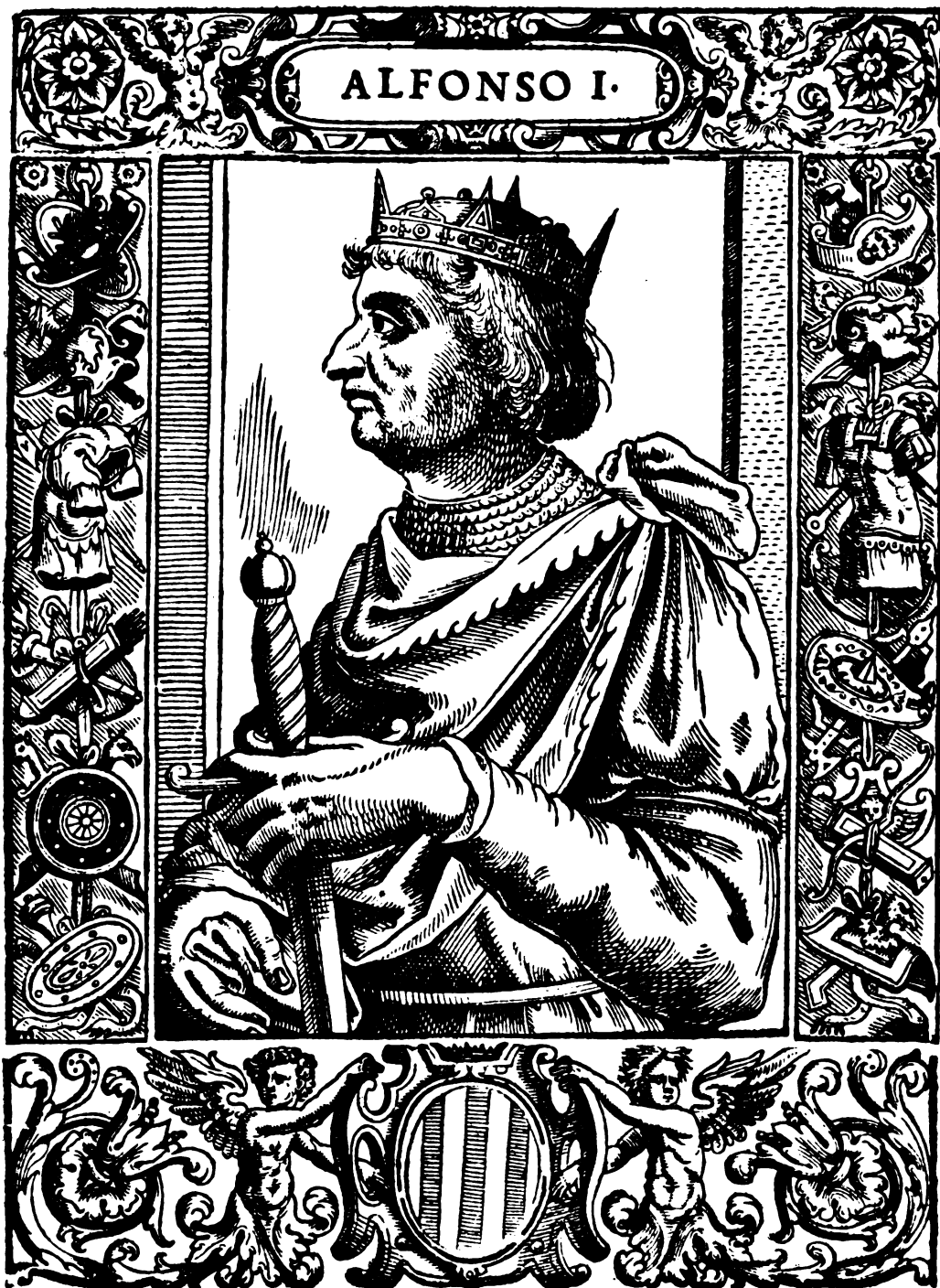
ALFONSO I. Aragonese adottato dalla Giouanna, e poi priu. dell'adozione dalla medesima, s'acquistò il Reame con l'arme. Fu sua moglie Maria sua consobrina, donna sterile. Morì nel 1458. d'anni 66. hauendone regnato 16.