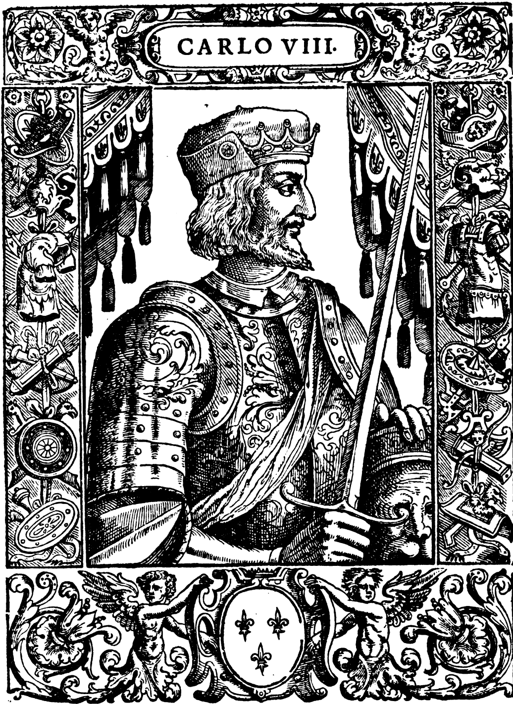
CARLO VIII. Re di Francia acquistò il Regno di Napoli, cacciandone Ferrante II. e lo tenne da vn'anno, e mezzo.