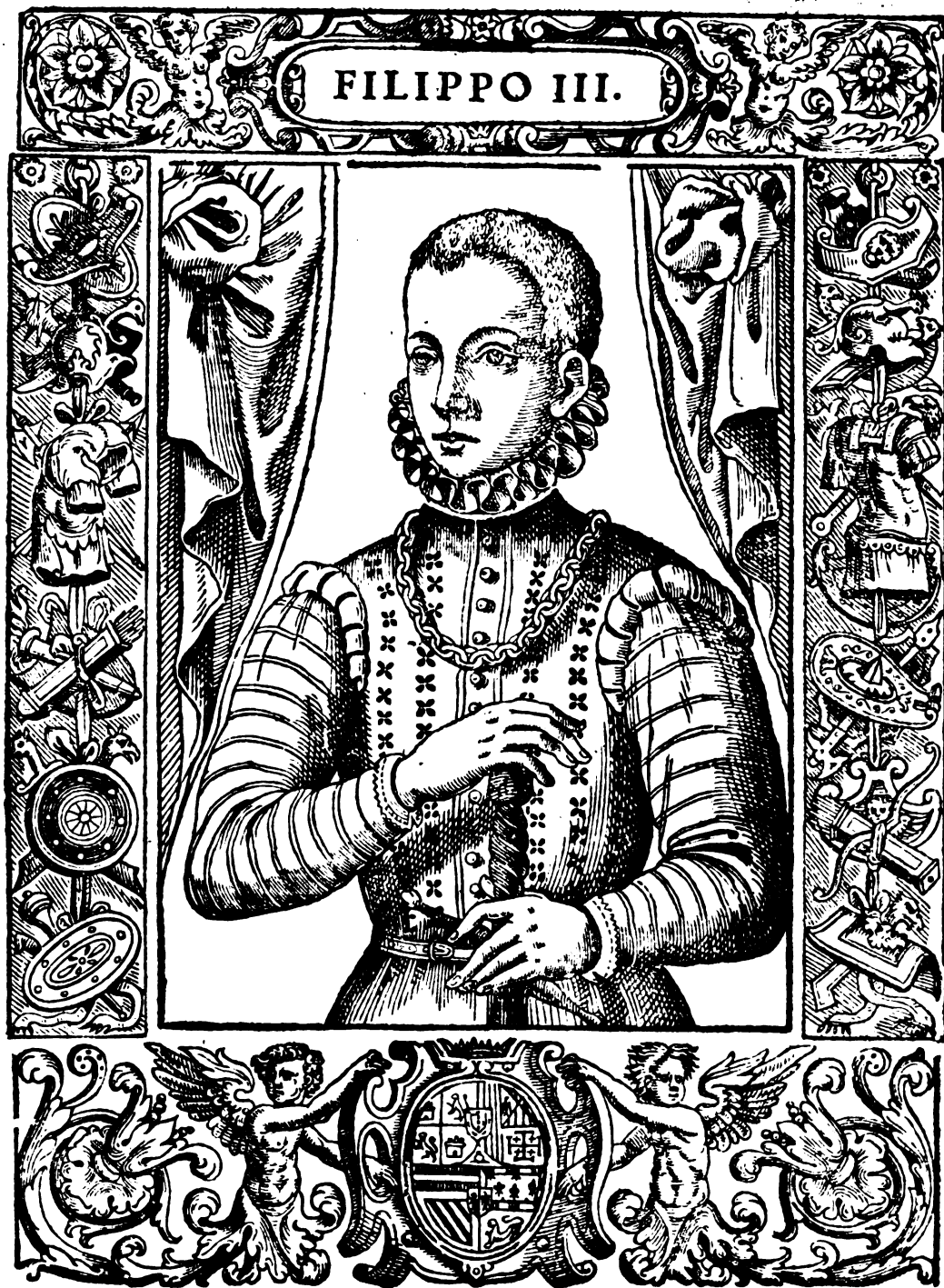
FILIPPO III. che al presente regna nacque del II. a 27 d'Aprile 1578. Fu gridato in Napoli a gli vndeci d'Ottobre 1598. e del seguēte mese di Nouembre sposò la Reina Margherita d'Austria figliuola dell'Arciduca, dellaquale l'anno pasato 1601. li nacque vna figliuola femina.