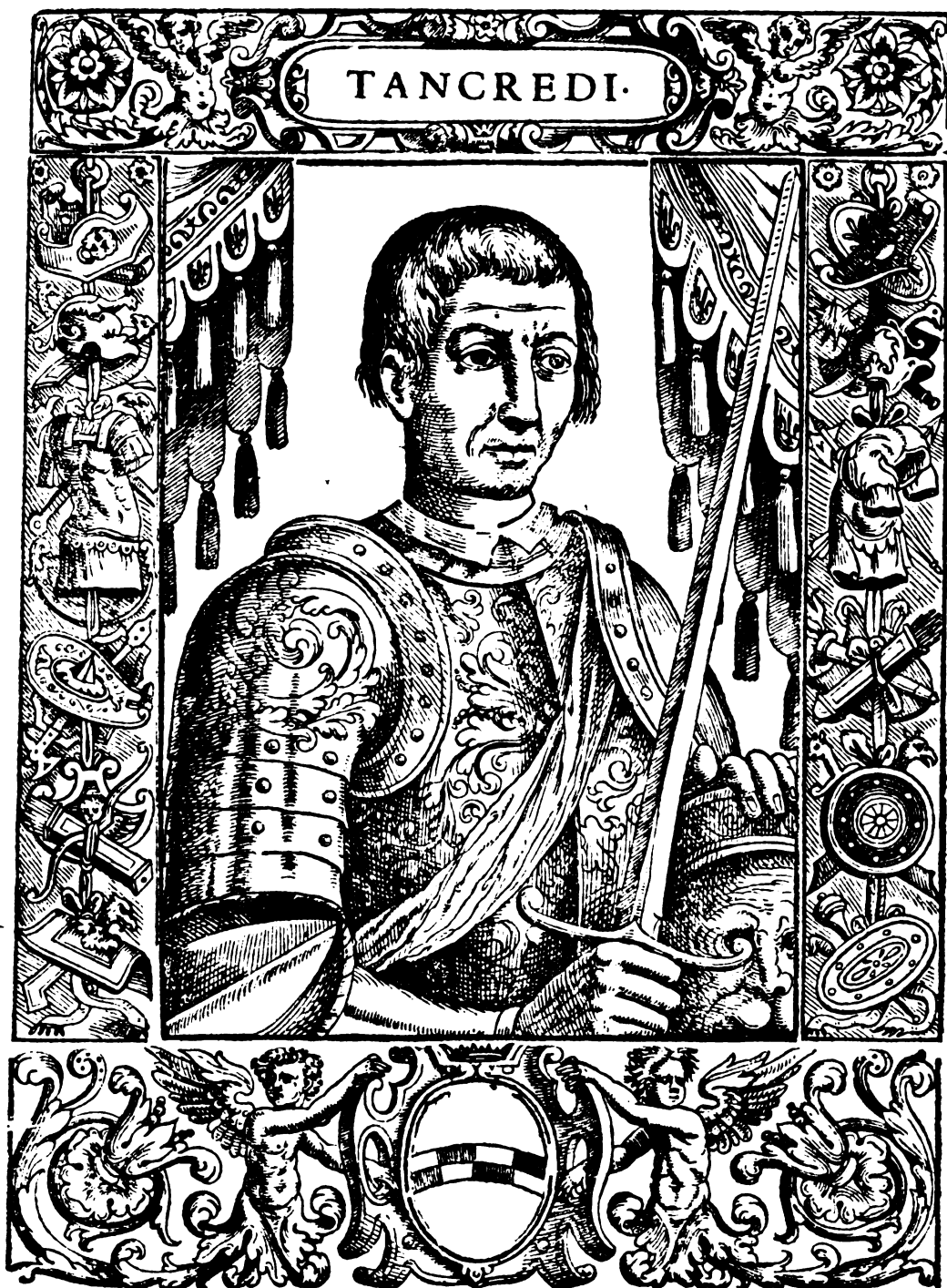
TANCREDI bastardo, non hauendo Guglielmo lasciati figliuoli, fu da'Siciliani eletto Re, e visse tale circa 6 anni, essendo morto nel 1194.