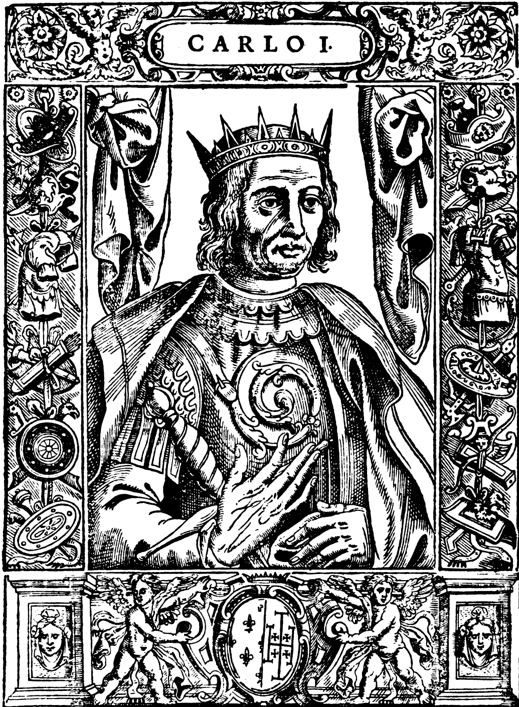
CARLO I. Angioino già Conte di Provenza, fù da Papa Clemente III. investito del Reame di Napoli, distrusse Manfredi, e poi Corradino. Morì nel 1285. d'età di 54. anni, e del suo Regno 19.