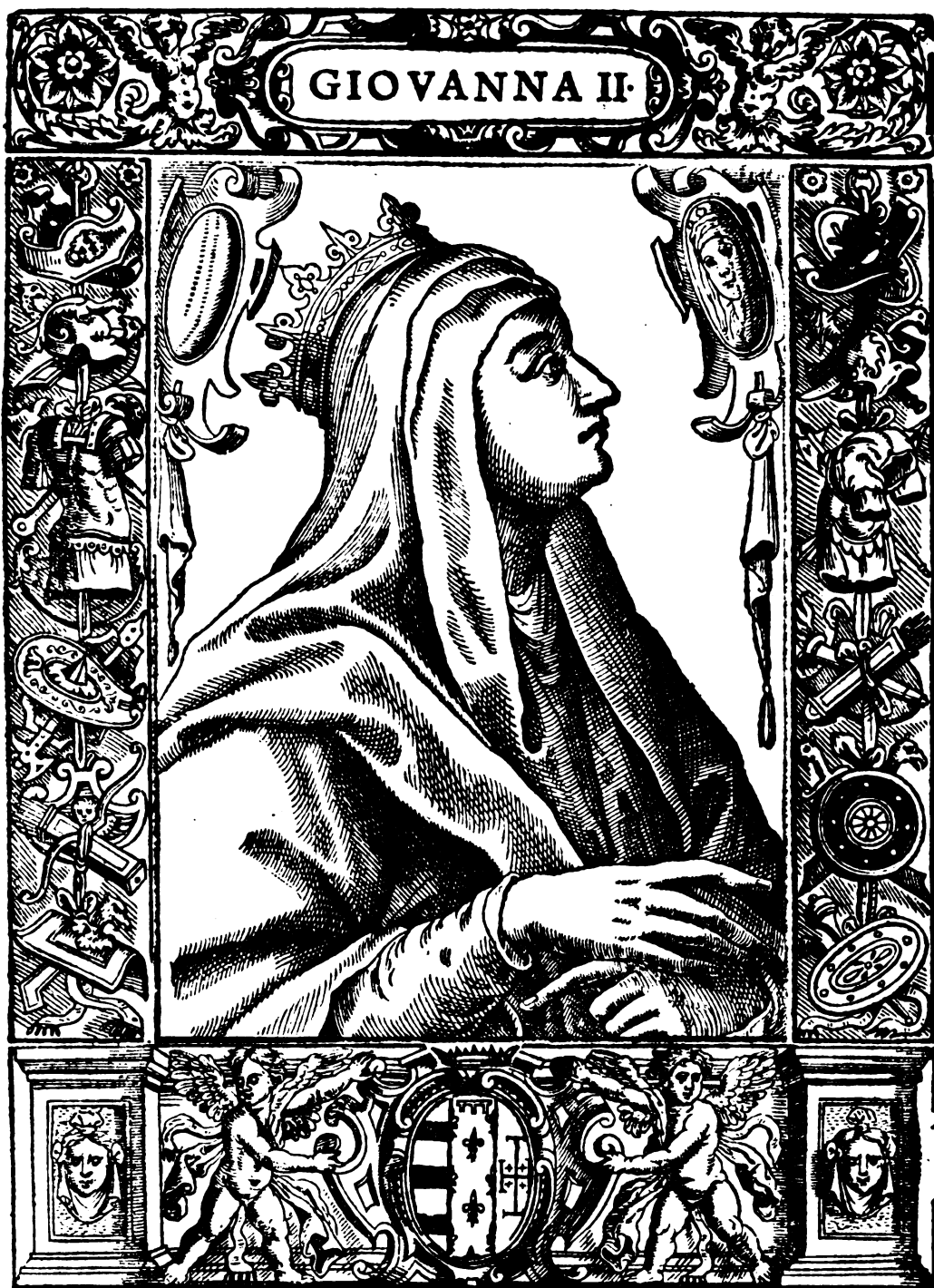
GIOVANNA II. sorella di Ladislao, tolse per marito il Conte Iacopo della Marce Prouenzale, effendo viuente il fratello stata moglie dell'Arciduca d'Austria, e rimasane vedoua . Costei s'adottò prima per figliuolo il Re Alfonso d'Aragona, e poi Luigi 3. d'Angiò figliuolo del 2. Vis's'ella 65 anni , hauendone regnato 20. ò poco più, e morì nel 1435 .