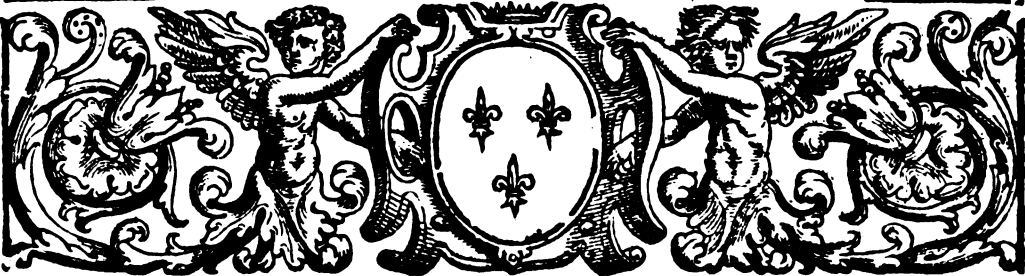
LVIGI XII. confederatosi col Cattolico, acquistò seco a parte il Regno di Napoli, cacciandone Federigo successor di Ferrante: ilche fu l'anno 1501. finche nel 1504. ne rimase spogliato dal detto Cattolico.