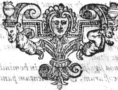
Et si Saturnus fuerit in signo pisc.

S aturnus cum fuerit dominus Eclipsis, uicinas, & castas subuisiones significat. Hae Alb. Saturnus cum fuerit dominus Eclipsis, uide Saturnus si so- lus deliquit dispositio fuerit, & de illo modo etiam facies iudicium.