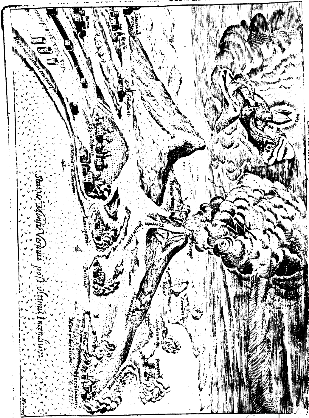
cuncta iacent flammis et truci mersa favilla.

Statu Mors Vesuvii post ultimū Incendium